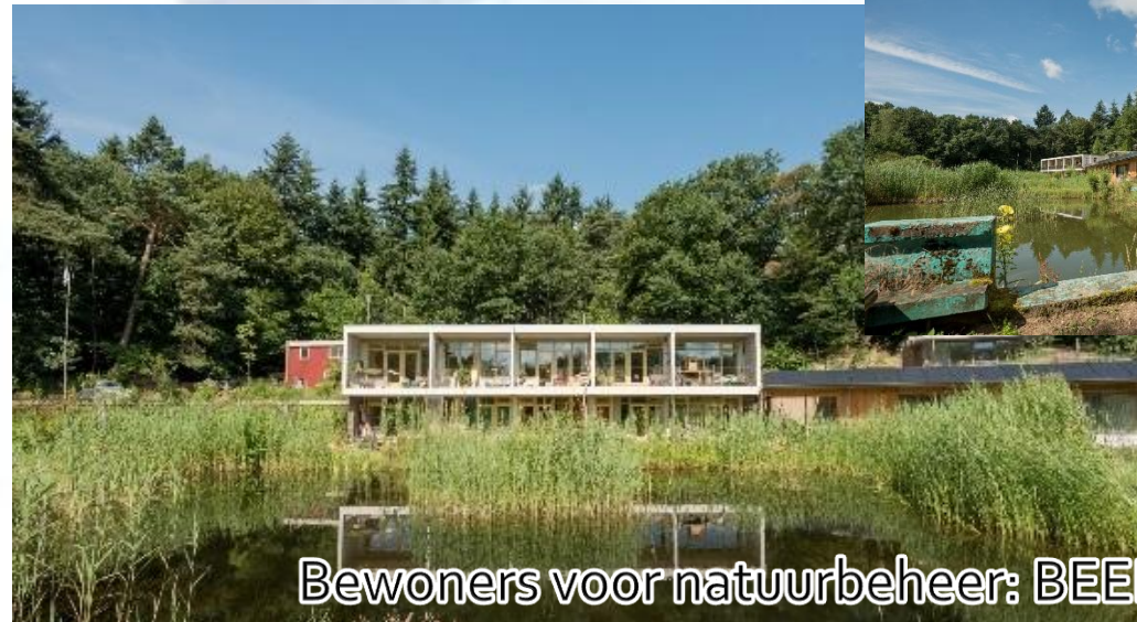
Bewoners voor natuurbeheer: BEEKHUIZEN