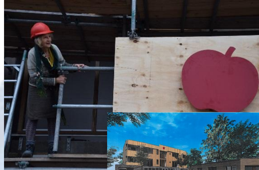
Bewoners in een groot-familie: STERAPPEL