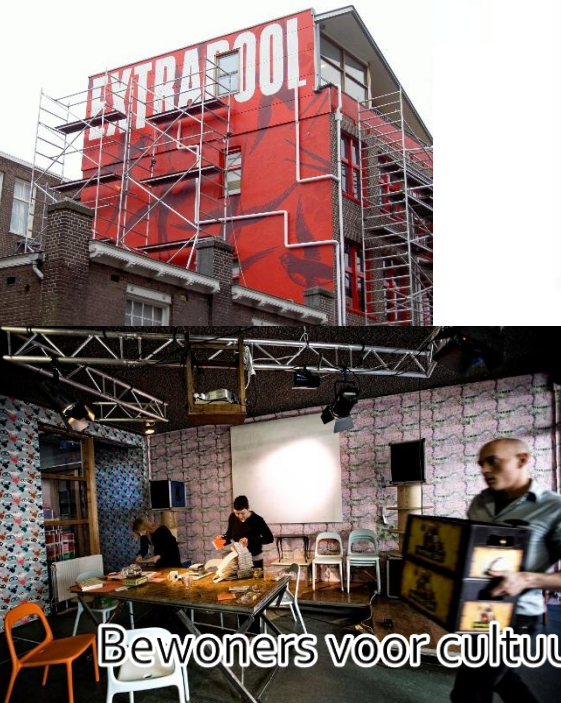
Bewoners voor cultuur: EXTRAPOOL